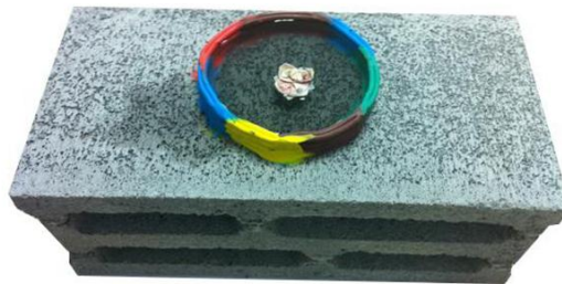
Mẫu thử tại công trường